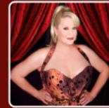
Daphne de Luxe